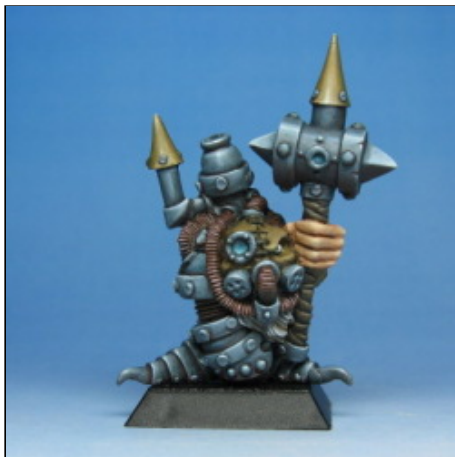
Thermo-Prêtre 01 (YF - 1999)

Peu à peu, le style s'affine et les nains s'équipent : de la cavalerie (le sculpteur des razorbacks reste inconnu), des armures Khor, et enfin des machines à vapeur, une belle trouvaille qui permet d'exploiter à fond le filon steam-punk, avec notamment les deux thermo-prêtres de Y. Fusier ou encore le thermo-prêtre monté de Cyril Abati. La plus belle pépite reste à ce jour la magnifique boîte de clan « La Confrérie d'Airain », sculptée en 2000 par C. Abati pour le Thermo-guerrier 01, Aragorn pour Lothan, Fenggar, le Familier mécanique et le second Thermo-guerrier, et l'incontournable Yannick Fusier pour le reste du clan. Créé à la même époque par Y. Fusier et repris par C. Abati, le Char nain, pendant longtemps le seul véhicule de toute la gamme Rackham, restera dans les cartons quelques années pour n'en sortir qu'à la publication du supplément « Fortification » de Confrontation, augmenté d'un servent maniant au choix une baliste (de Y. Fusier) ou un canon (de Benoît Cosse).