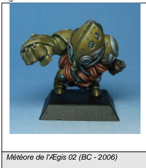
Météore de l'Ægis 02 (BC - 2006)

Ce n'est qu'en 2006 que les affaires redémarrent vraiment. À force d'être réclamées sur les forums, une série de trois naines pas vilaines finit par voir le jour. Certaines sorties séduisent également par leur dynamisme, comme les Météores de l'Ægis et leur meneur Fulgur.