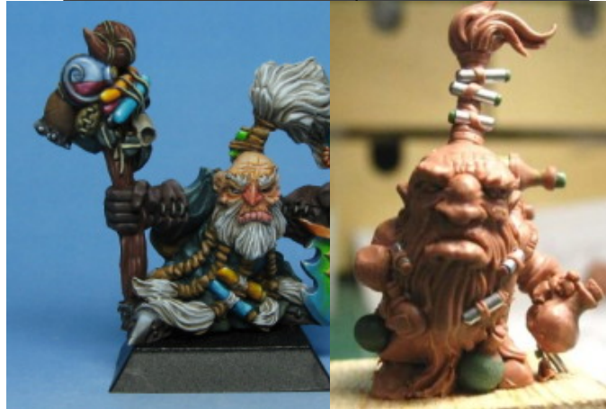
Bâl-Torg (YF - 1998)